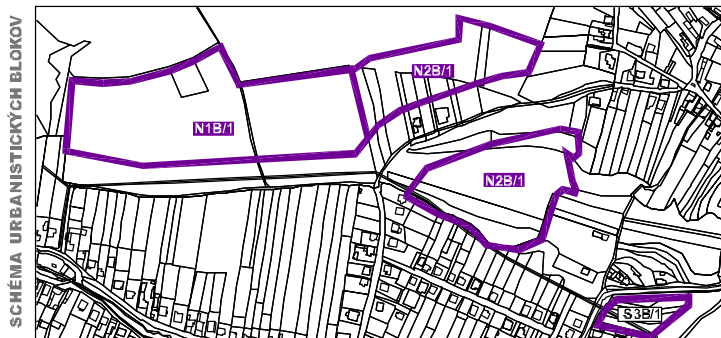
SCHEMA URBANISTICKÝCH BLOKOV