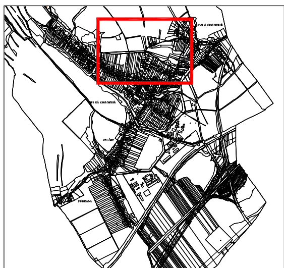
SCHEMA POLOHY VÝREZU ZA D Č.1