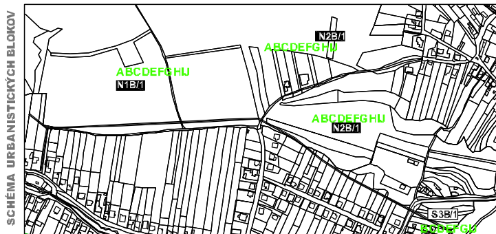
SCHEMA URBANISTICKÝCH BLOKOV