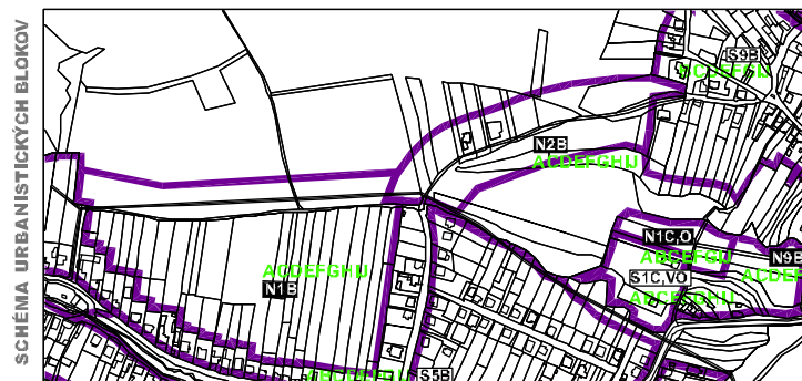
SCHEMA URBANISTICKÝCH BLOKOV