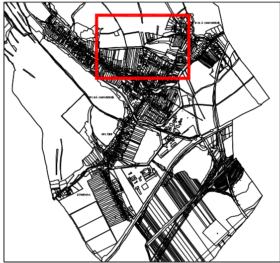
SCHEMA POLOHY VÝREZU ZaD č.1

Poznámka: presné trasovanie navrhovaných ciest bude stanovené v následných dokumentáciách (vyhľadávacia štúdia, urbanistická štúdia) na základe polohopisného výškopisného zamerania a iných relevantných podkladov