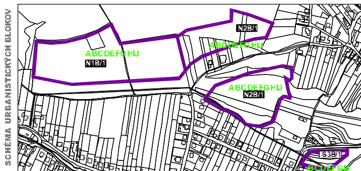
SCHEMA URBANISTICKÝCH BLOKOV